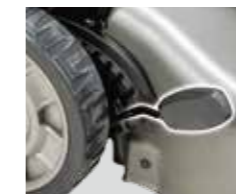
可单手调节切割高度 20 - 100mm (10级)