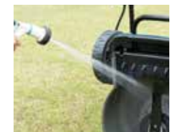
切割舱的内部可以清洗 (自走式部分不能被水弄湿)